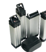
Zware en krachtige lithium batterijen van elektrische fietsen